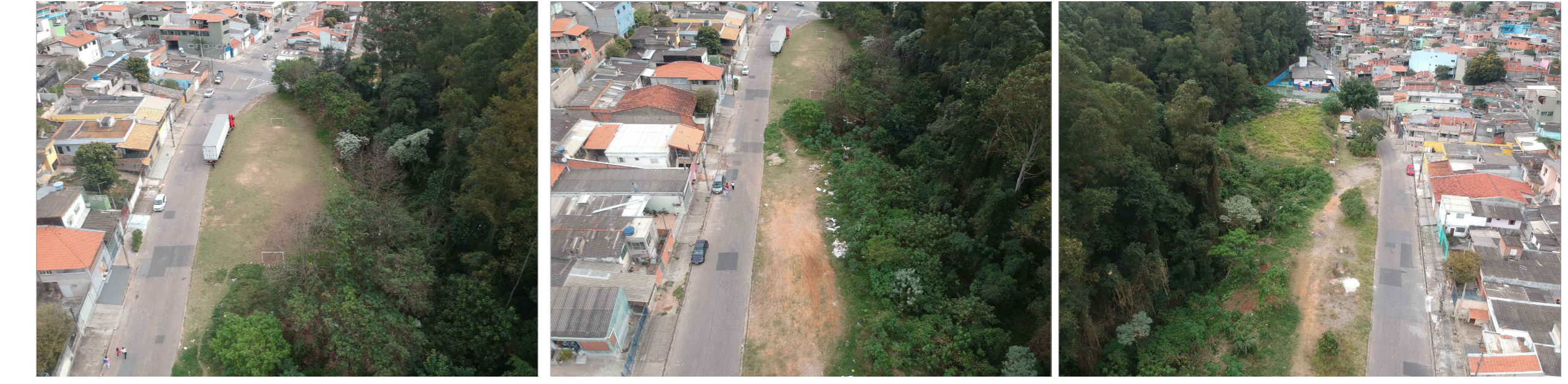
FOTOS DO LOCAL - Rua São José do Rio Pardo