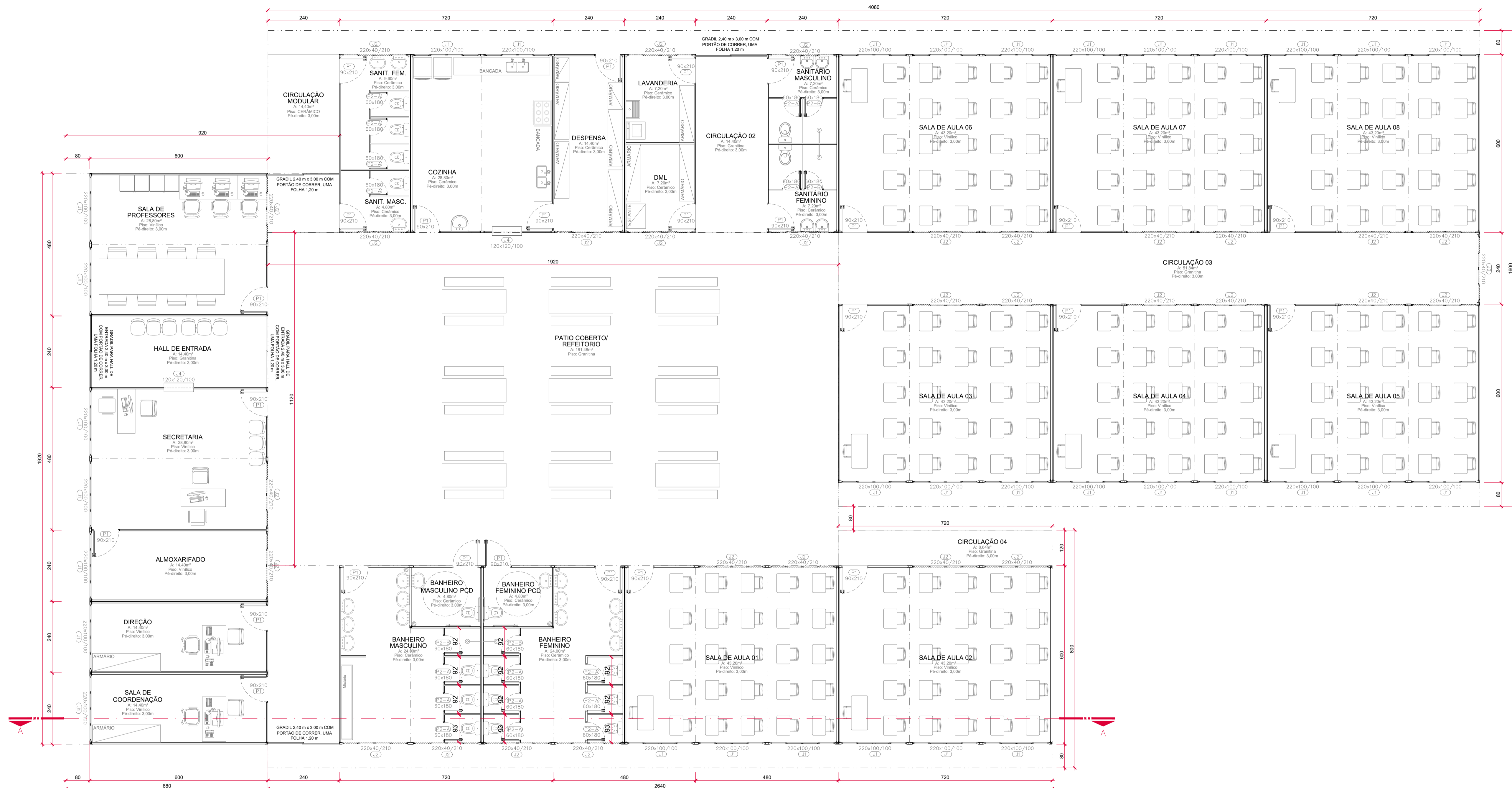
PLANTA BAIXA ESCALA: 1/50